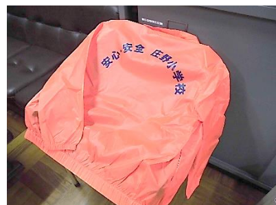
「安心安全庄野小」ウインドブレーカー