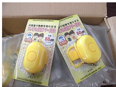
防犯ベルと贈呈証