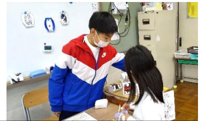
にゃんこ大戦争しやてきや