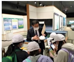
しりょうかんけんがく 【資料館見学】

おこな 下調べをしっかりと行っているだけに、どの展示場所に行っても、ねっしん 熱心にメモをとる子どもたちのすがたがありました。