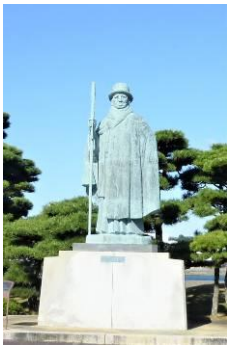
しんじゅしまとうちやく 【真珠島到着】

がっこう 学校 — ミキモト しんじゅしま しりょうかんけんがく 資料館見学・あまじつえん 海女実演ショー・まんげきょうづく 万華鏡作り体験) — とばすいぞくかん 鳥羽水族館 (弁当・けんがく 見学) — がっこう 学校