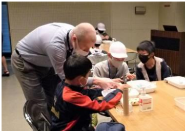
まんげきょう たいけん 【万華鏡づくり体験】