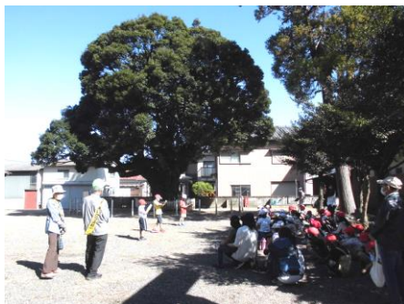
スタジイ，川俣神社訪問2年生

10月からは，読み聞かせボランティアさんにも校内で活動をしていただいています。オンラインを活用して感染症対策をしながらの活動ということでご不自由をかけています。朝の10分間，落ち着いた空気と読み聞かせボランティアさんの声が校舎に響いています。