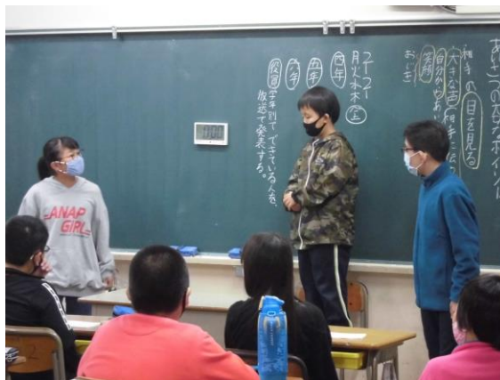
新役員、児童会であいさつ運動について討議