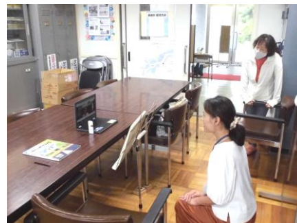
読み聞かせボランティアさん，準備風景