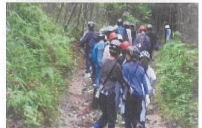
間伐体験にむかいます