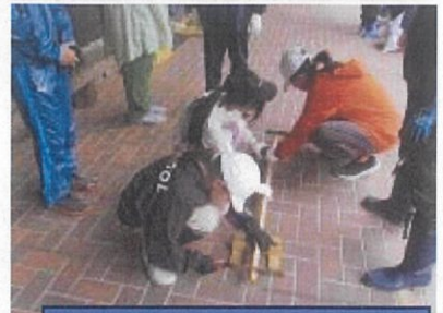
キーホルダーづくり

朝早くからの、お弁当作りをはじめ、事前の準備など、様々な面でサポートいただき、本当にありがとうございました。