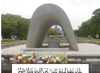
げんばくしほつしゅいれいひ 原爆死没者慰霊碑