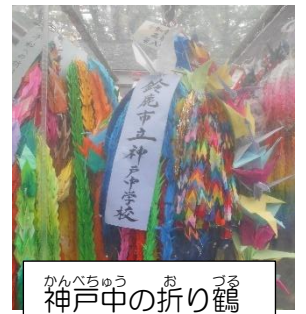
かんべちゅうのおづる 神戸中の折り鶴