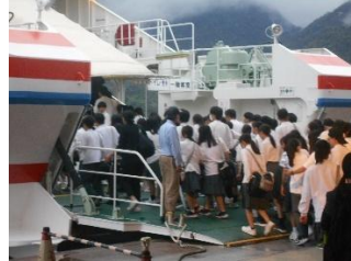
フェリー乗船の様子