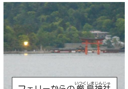
フェリーからのいづしまじんじや 厳島神社