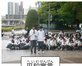
へいわせんげん 平和宣言