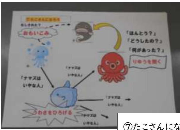
⑦ たこさんになろう