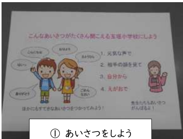
① あいさつをしよう