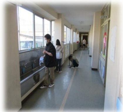
1年生前の廊下や流しもきれいにしています。