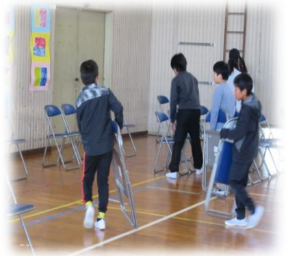
会場の椅子を、等間隔に真すぐ、丁寧に並べています。

6年生のおかげで、式場は春らしい明るさと優しさに満ちた空間になりました。ありがとう、6年生のみなさん。