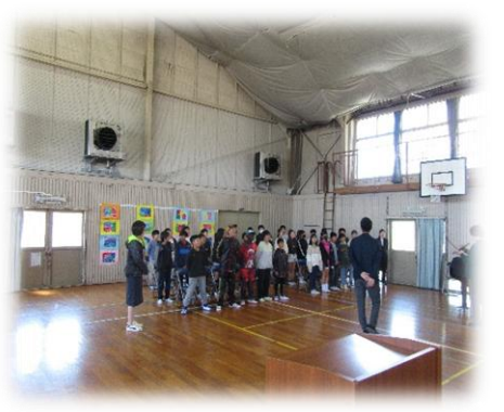
会場設営後、歌の練習をしました。とっても元気で力強い歌声でした。