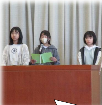
三校の代表あいさつ