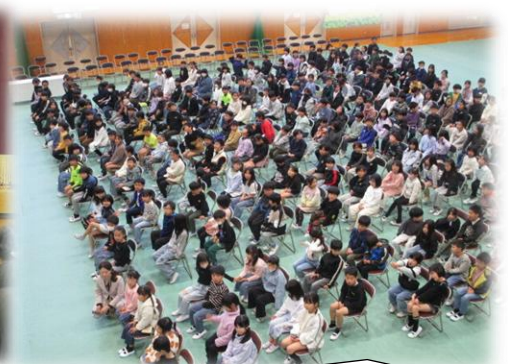
自分がどこにいるのかわかりますか？