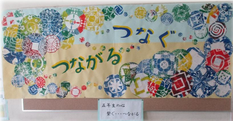
5年生の作品「五年生の心 繋ぐ……つながる」

12月も半ばが過ぎ、長いと感じていた2学期もうすぐ終わり今年もわずかとなりました。冬も本格的に訪れ気温がかなり低い日もあります。残り少ない2学期、体調管理を怠らず元気に過ごしてほしいと思います。