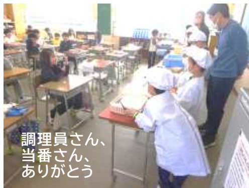
調理員さん、 当番さん、 ありがとう