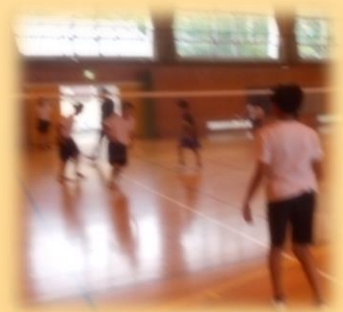
【バドミントンクラブ】⑪