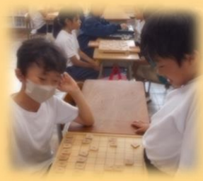
【オセロ・将棋クラブ】⑫