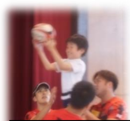
ラインアウトを体験させてもらいました