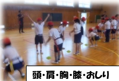
頭・肩・胸・膝・おしり