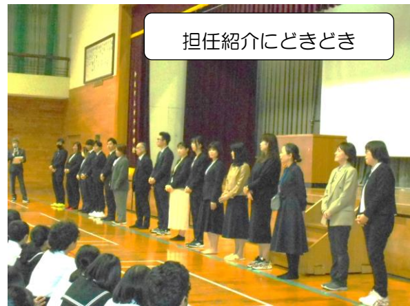
担任紹介にときどき

新しいクラスを見て、歓声を上げる生徒たち。これからどんな1年になるのかな。期待で胸がふくらみます。