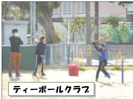
テニスボールクラブ