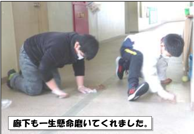
廊下も一生懸命磨いてくれました。

6年間の思い出を振り返りながら、黙々と、そして丁寧に組み立てていきました。残り少ない小学校生活の中で、少しでも鼓ヶ浦小学校をきれいにしたいという気持ちが、活動する姿から伝わってきました。6年生のみなさん、一生懸命作業してくれてありがとうございました。