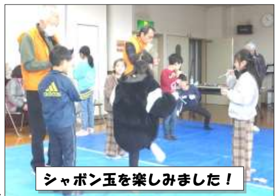
シャボン玉を楽しみました！