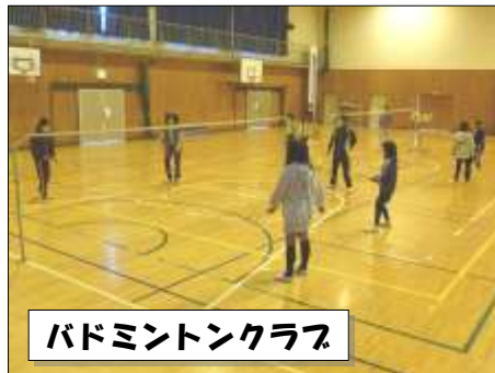
バドミントンクラブ