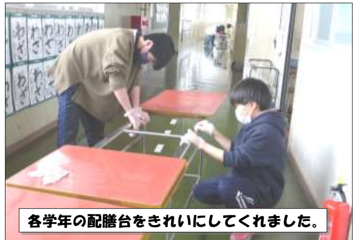
各学年の配膳台をきれいにしてくれました。