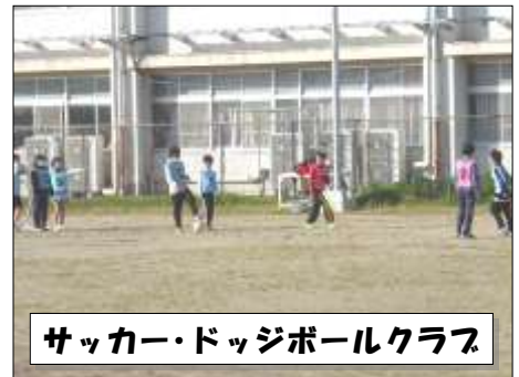
サッカー・ドッジボールクラブ

鼓ヶ浦小学校のクラブ活動には、多くのボランティアの方々にもご協力とご支援をいただいております。子どもたちの活動が充実したものとなりました。お力添えをいただきましたボランティアのみなさま、1年間本当にありがとうございました。