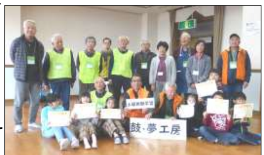
最後に集合写真を撮りました