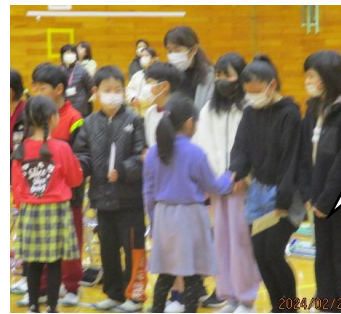
大好きな6年生 にお手紙を書い て渡しました。