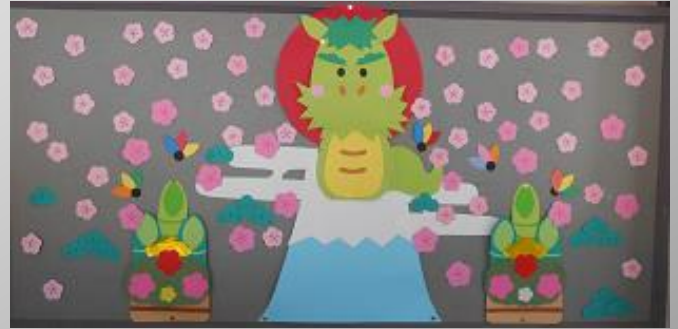
【1月の図書室前の掲示板より】