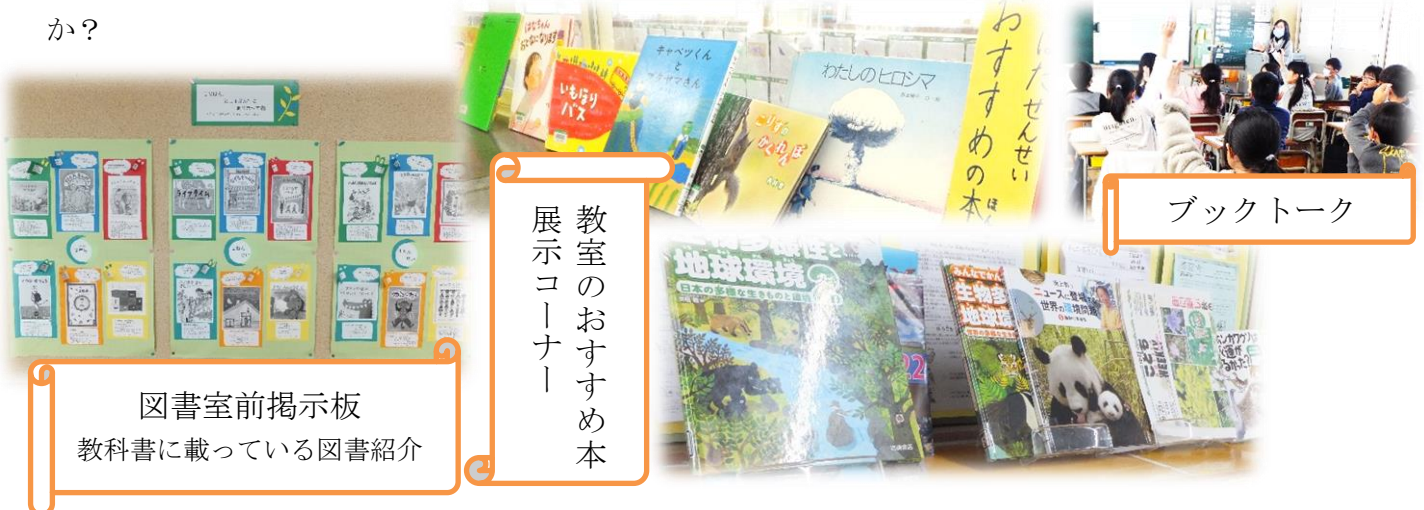
図書室前掲示板 教科書に載っている図書紹介

応募用紙に必要事項を記入のうえ、作品に添付して、職員に提出してください。(応募用紙は館内にも備え付けてあります。)