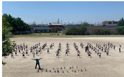
◎体操は前後広く開けて(1年生)