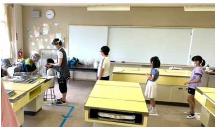
◎歯科検診は広い教室で(4年生)