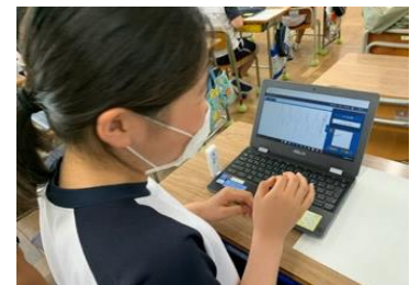
◎一人1台パソコンで学習(5年生)