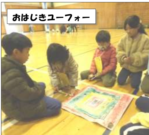
おはじきユーフォー

2年生が生活科の授業で作った手作りのおもちゃで、1年生を「おもちゃランド」に招待する取組を行い、自分たちの学習成果を体験活動へと、より深めることができました。