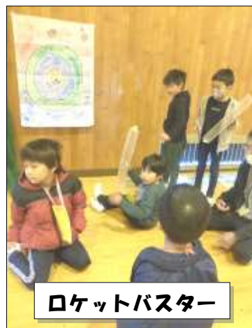
ロケットバスター