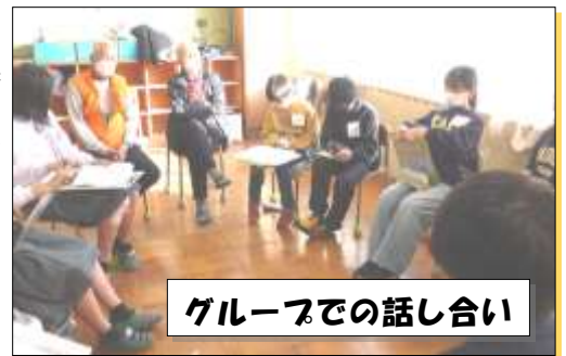
グループでの話し合い