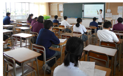
分散登校で半分になった教室 やっと、全員そろいますね

4月、5月と各学年、数日間の登校でしたが、6月2日(火)より5限授業となり給食も始まります。いよいよ本格的に学校生活が始まりますが、次の点を確認しておきましょう。