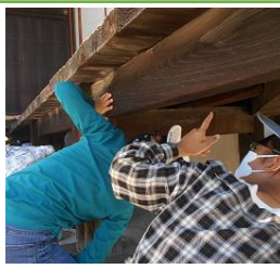
【うぐいすばりの秘密】