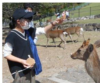
【鹿せんべいをあげるよ】