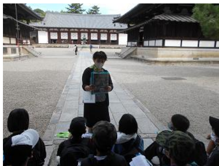
① 法隆寺の見学の様子について