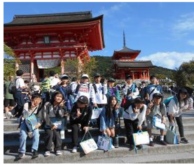
【清水寺仁王門前にて】