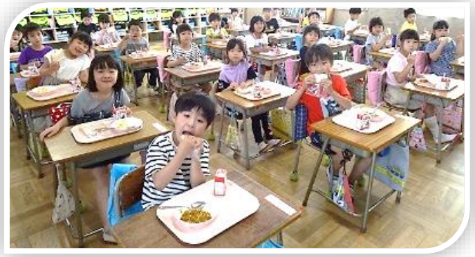
初めての給食(1年生) 全員が前を向いて食べます。