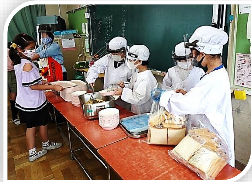
フェイスシールドを着用して盛り付け