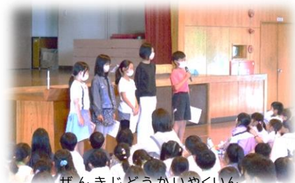
ぜんきじどうかいやくいん 【前期児童会役員】

ひょうしょうしき ぜんきじどうかいやくいんにんめいしき ねんせい むか 表彰式、前期児童会役員任命式、1年生を迎える かい おこな 会を行いました。