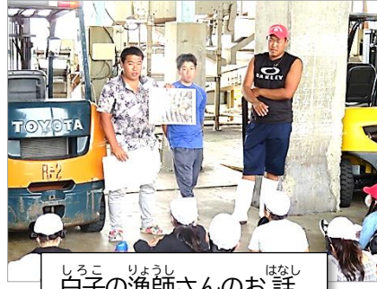
白子の漁師さんのお話