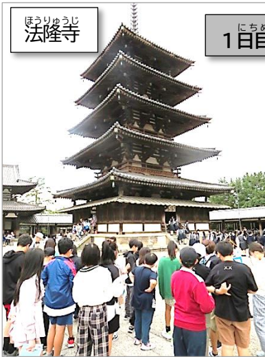
ほうりゅうじ 法隆寺

10月5日(木)～6日(金)に6年生が奈良・京都へ修学旅行に出かけました。1日目は法隆寺と東大寺、三十三間堂の見学、清水寺の見学と清水坂での買い物、そして楽しみにしていた旅館での宿泊。2日目は、銀閣寺、二条城、金閣寺の見学、そして太秦映画村の班別行動。アトラクションに挑戦し、土産物を手にして忙しそうに走り回る6年生の姿がありました。この2日間で京都・奈良の歴史・文化に見聞を深めることができ、共に生活することで仲間とのつながり(愛と絆)を深めることができました。小学校生活の最高の思い出作りができた修学旅行となりました。