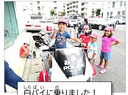
白バイに乗りました！