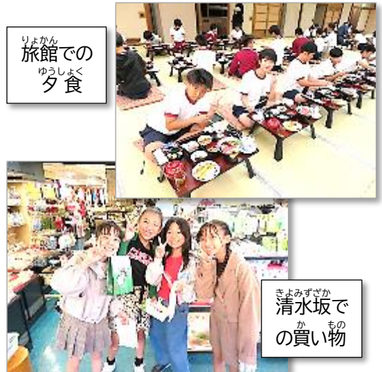
りょかん 旅館での 夕食