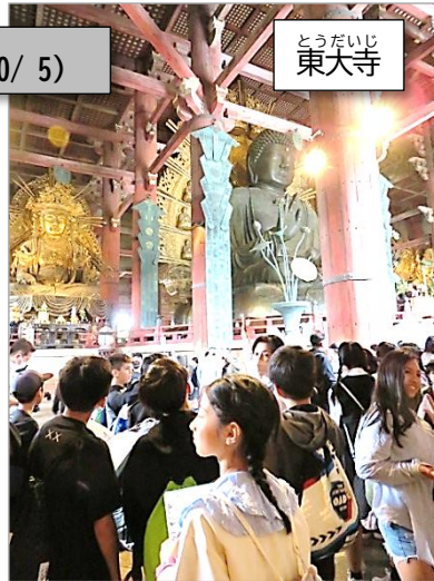
とうだいじ 東大寺