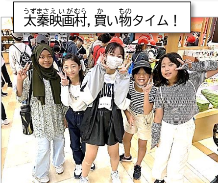
うずまさえいがむら か もの 太秦映画村、買い物タイム！