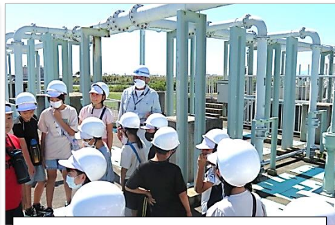
ヘルメットを着用して施設見学！