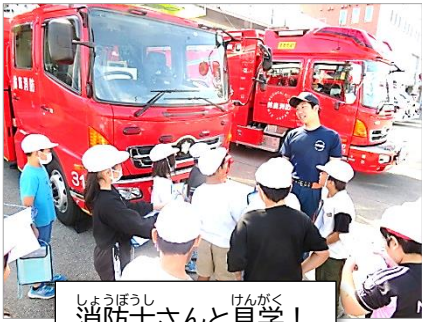
消防士さんと見学！

鈴鹿市中央消防署、白子漁港、鈴鹿警察を見学し、最後に桜の森公園を訪問しました。施設の見学だけでなく、働く人の思いも聞くこともでき、社会科学習をより深めることができました。