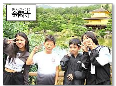
ぎんかくじ 金閣寺