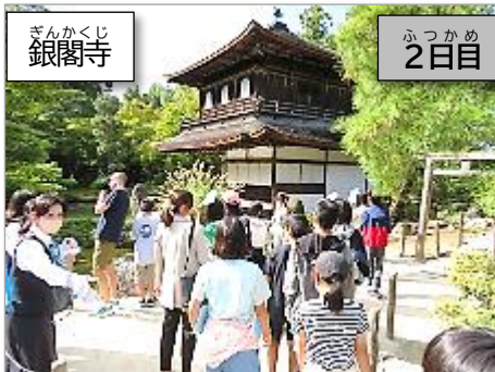
ぎんかくじ 銀閣寺