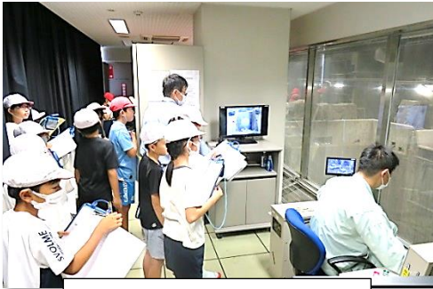
ごみクレーン操作室見学！

鈴鹿市清掃センター、南部浄化センター、伝統産業会館を見学しました。ごみが焼却されたり、生活排水が浄化されたりする様子を見学でき、伊勢型紙彫りの体験学習もできました。