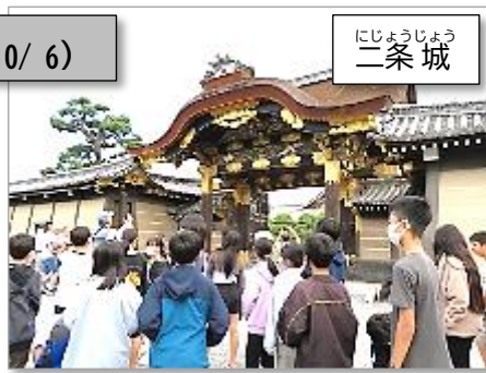
にじょうじょう 二条城