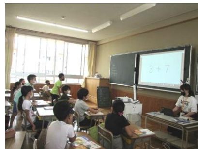
【みんなで学習すると活気が出ます】

長期の臨時休業であったため、学習の進度は遅れていますが、子どもたちの定着状況等を確認しながら、学年の実情に応じて、以下のような取組を進めていきます。