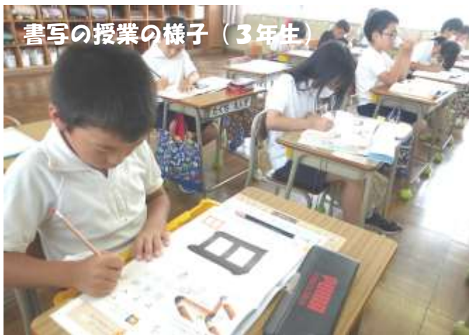
書写の授業の様子（3年生）