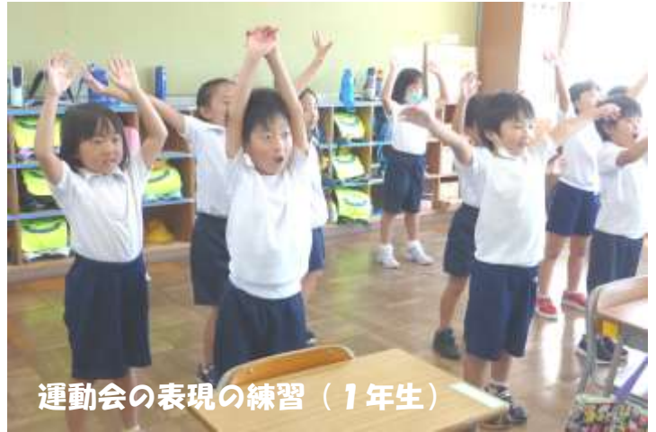
運動会の表現の練習（1年生）

いよいよ来週からは運動会に向けての練習も始まります。すでに、各学年より運動会練習期間中の服装や持ち物等についてご連絡をさせていただいておりますが、水筒や汗拭きタオル、場合によっては着替えの準備をお願いします。また、運動会の練習に伴って、時間割が変更になることがありますので、ご家庭でも連絡帳を確認していただくとありがたいです。詳しくは、各学年通信をご覧くださいますようお願いいたします。今後も厳しい暑さが続きそうです。お子様の健康管理等、ご家庭でも気をつけてみていただきますようお願いいたします。