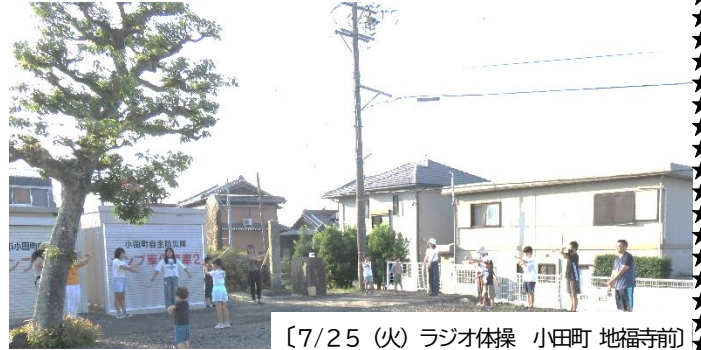
〔7/25 (火) ラジオ体操 小田町 地福寺前〕

2学期を迎えるにあたって、ご家族で過ごされる中で、お子様の何気ない言葉や行動を観察していただき、気になる事や心配な事などがありましたら、小さなことでも結構ですので、学校にご連絡、ご相談いただきますようよろしくお願いいたします。学校に直接、伝えることを迷われる場合は、終業式に、お子様を通じてお配りしました「ひとりで悩まず相談しよう」の相談窓口もご活用ください。