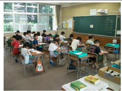
【3年】プリント学習に集中。