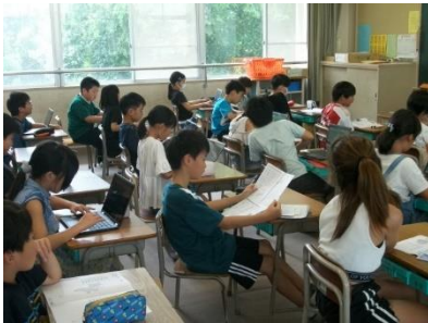
【4年】都道府県名テスト。夏休みの学習の成果を確認。