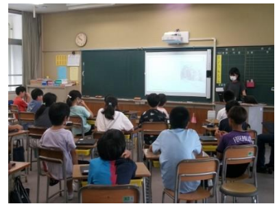
【6年】調べてきたことをプレゼン中。