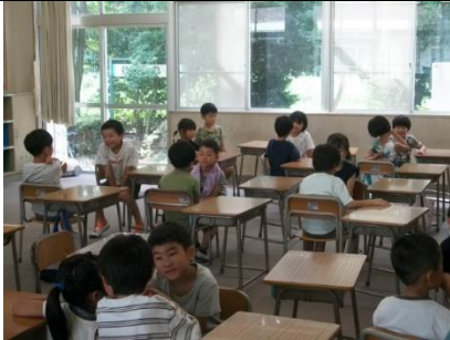
【1年】夏の思い出の交流。

8月18日の登校日の様子です。まずは、夏休みの宿題を集めたり、内容の確認をしたりしました。その後は、二期に向けて教科書の音読をしたり、まとめのテスト等で夏休みの学習の成果を確かめたりしていました。子どもたちの夏休み気分も一気に変わったのではないかな、と思いました。