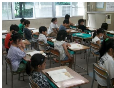
【2年】さっそく国語の教科書の音読。