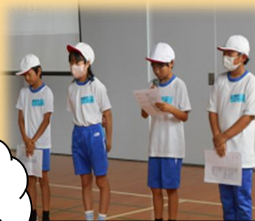
準備万端・庄内小を紹介しました。