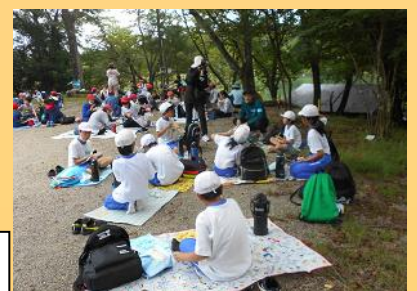
各学校でお弁当を食べました。

お家から持ってきたお弁当を「大門池広場」で学校ごとに集まっておいしく頂きました。