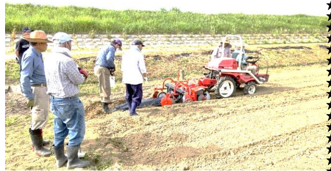
農業委員さんによるサツマイモ畑(1・2年生)の耕運

5月28日(日)には、農業委員さんに鈴鹿川の堤防の北側の畑の開墾と体育館南側の畑に棚を設置していただきました。堤防の北側の畑には、毎年、1, 2年生がサツマイモの苗を植えており、今年は6月15日(木)に植える予定です。また、体育館南側の畑に支柱と網棚を設置していただき、5月31日(水)に、4年生がツルレイシ(ゴーヤ)の苗を植えました。