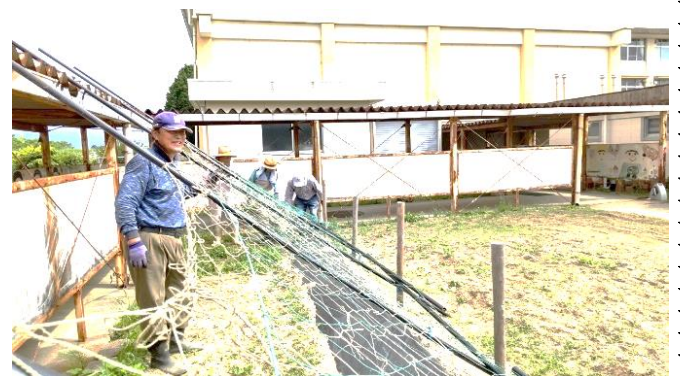
4年生のツルレイシ(ゴーヤ)用の支柱の設置