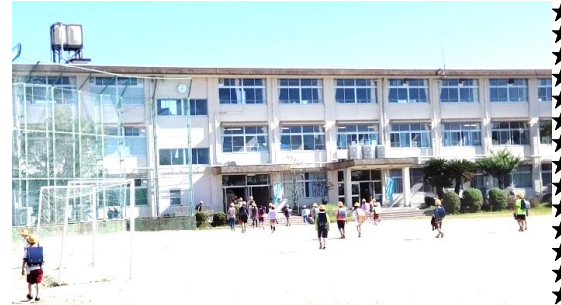
6/5(月) 金曜日の大雨から、晴天になりました。

今後も天候によっては、この日のような急なお願いをさせていただくこともあろうかと思いますが、ご理解ご協力をいただきますようよろしくお願いいたします。