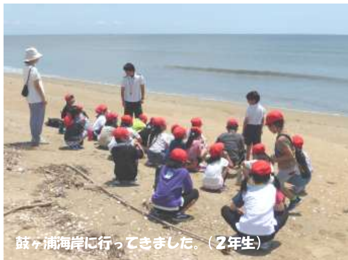
鼓ヶ浦海岸に行ってきました。(2年生)

今月9日(金)には3年生が寺家の子安観音寺へ、13日(火)には2年生は鼓ヶ浦海岸へ、それぞれ「まちたんけん」に行ってきました。3年生は子安観音寺の住職さんからお話を聴きましたが、みな静かにしっかりと聴くことができました。また、2年生は鼓ヶ浦海岸で貝がらを拾ったり、砂浜に絵を描いたり、美しい砂浜で楽しく過ごすことができました。私たちが住む、鼓ヶ浦のいいところをたくさん見つけてもらえたらうれしいです。