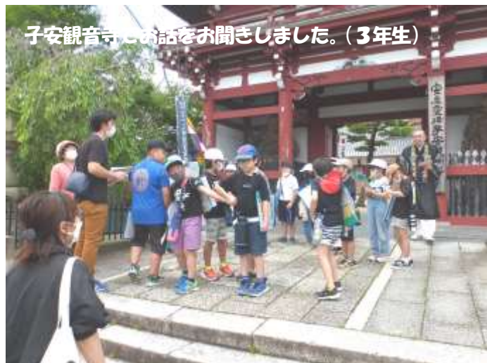
子安観音寺でお話を聴きました。(3年生)