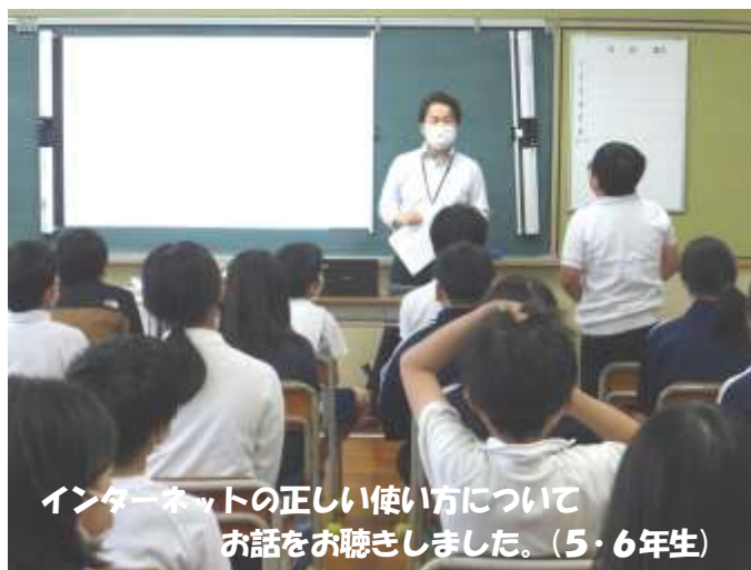
インターネットの正しい使い方について お話を聴きました。(5・6年生)

本校では一人1台クロームブックを所有し、様々な学習活動に使用しています。また、子どもたちの身のまわりには、スマートフォン(SNS)や通信型ゲーム機、音楽プレーヤー等、インターネットに接続できる環境が多様化し、身近なものになっています。