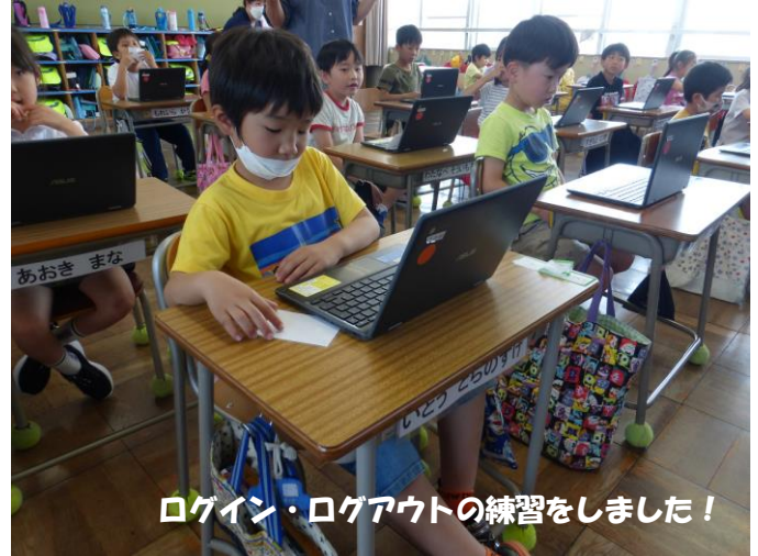
ログイン・ログアウトの練習をしました！