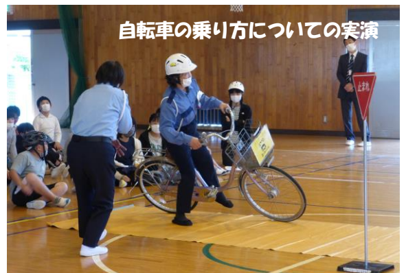
自転車の乗り方についての実演