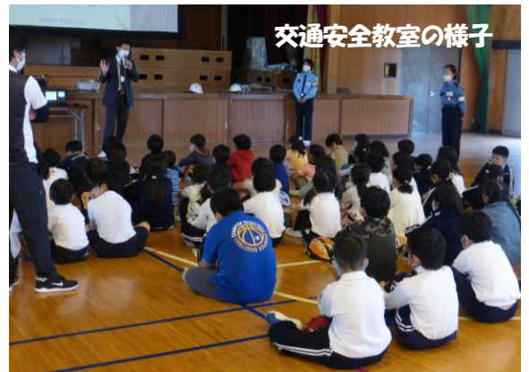
交通安全教室の様子

また、道路交通法の一部改正により、今年4月1日から全ての自転車利用者に乗車用ヘルメットの着用が努力義務化されました。ヘルメットの着用だけでなく、交差点での一時停止や安全確認など、交通ルールやマナーを守って、安全に自転車を利用しましょう。