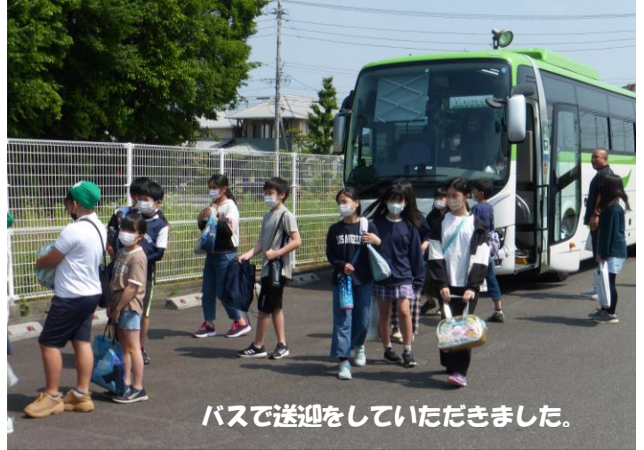
バスで送迎をしていただきました。

本年度の水泳の授業は、2つの学年を4つのグループに分けて、それぞれインストラクター(コーチ)の方に水泳の技術指導等をしてい