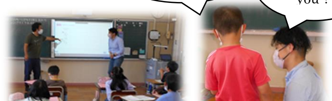
【3年・英語の授業】全体で練習→個々に3人と練習