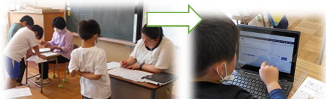
【4年・算数の授業】T・Tでまとめのプリント→ICT確認