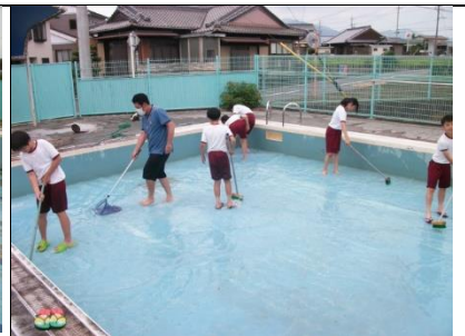
綺麗になりました