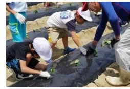
4人のふるさと先生が事前に畝を作りマルチシートしてくださいました。