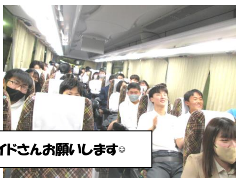
ガイドさんお願いします◎

コロナ感染が一番心配された時期での予約や計画であったため、見学地としてはいろいろと制約を受けましたが、小学校の時には行けなかった古都、京都も見学地に入れてあり、満喫できた3日間だったのではないのでしょうか。