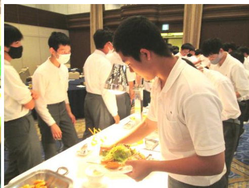
1日目は新神戸駅からの班別行動 電車に乗っての移動 神戸の街並と中華街の散策 食べ歩き 夕方にはハーバーランドに集合しオリエンタルホテルへ

かったり…と、計画的にいかなかったことも多かったと思います。でも、そこが旅行のいいところ。多少の困難も仲間の知恵と工夫で乗り切り、大きな経験をしたものと思います。実際に経験したことは宝物です。自分の目で見て、耳で聞いて、鼻で嗅いで、口で味わい、手での感触を感じることで深く記憶に残ります。