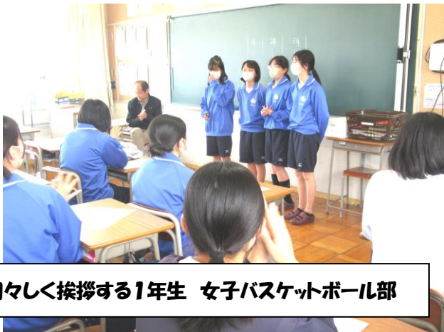
初々しく挨拶する1年生 女子バスケットボール部

自分自身の課題の悩みなど、クラスにいるときよりも摩擦が起きやすい場でもあります。その摩擦を味わい、向き合い、自分と折り合いをつけたり、仲間と支えあってやりきること、勝つことを目指したその先にある、粘り強さ、調整力、寛容さ、人間力、自信を獲得していきます。