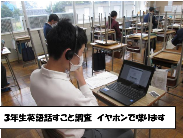
3年生英語話すこと調査 イヤホンで喋ります