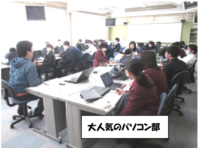
大人気のパソコン部

4月28日の放課後は、1年生が正式入部として初めて顔を合わせるミーティングが行われました。2年生にとっては初めての後輩ができました。自己紹介に、それぞれの部屋からは歓迎の大きな拍手が聞こえていました。部活動では興味関心の領域を深めたり、技能を高めたりすることはもちろんですが、人間関係を学びます。特にチーム戦となる種目については勝負の場面も出てくることから縦と横の関係、指導者と部員の関係、