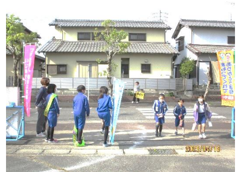
児童会のあいさつ運動