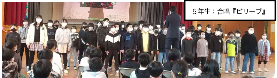
5年生：合唱『ビリーブ』