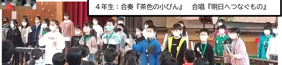
4年生：合奏『茶色の小びん』 合唱『明日へつなぐもの』