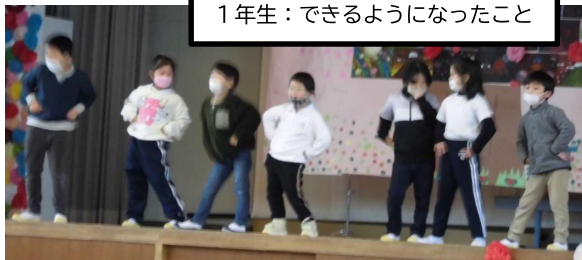
1年生：できるようになったこと