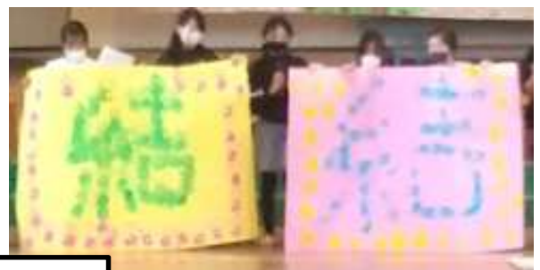
引き継ぎセレモニー