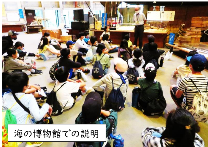
海の博物館での説明