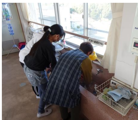
扇風機の羽をきれいにしました。

6年生とボランティアさんのおかげで、国府小学校はピカピカになりました。ありがとうございました。