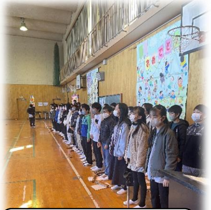
5年生 威風堂々(入場) 糸(退場)