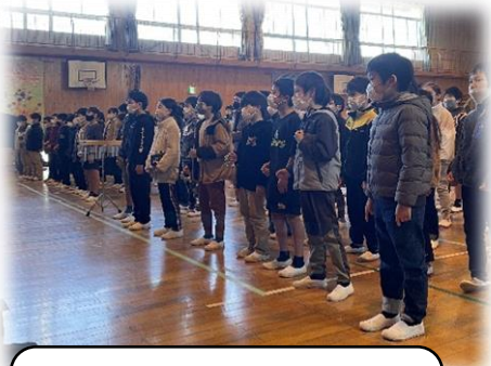
4年生 又千ドゥタカラ 道化師のソネット