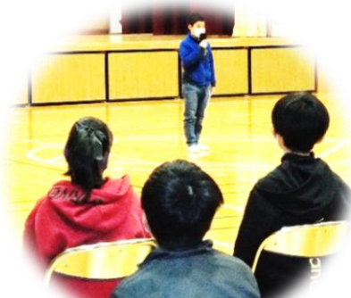
5年生 はじめの言葉