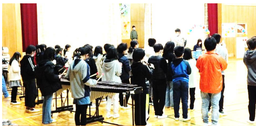
5年生 「威風堂々」(合奏) (6年生入場時)