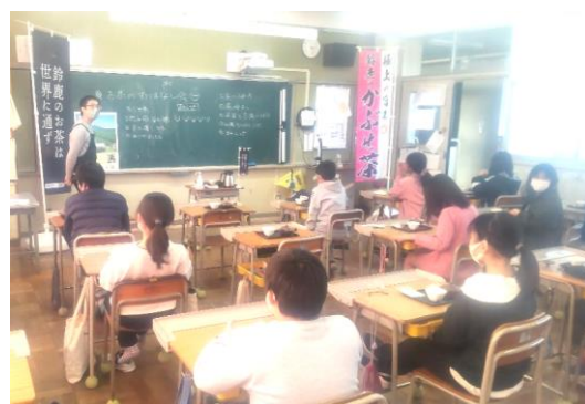
市役所 農林水産課によるお茶のお話し会