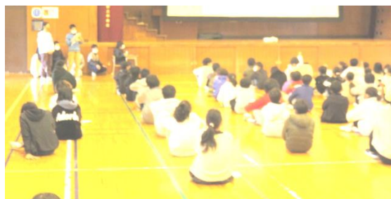
2022/12/7 6年生修学旅行学習発表会