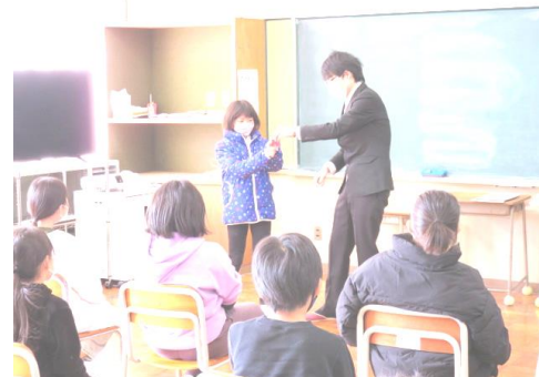
2年・4年 ALSOK 安全教室