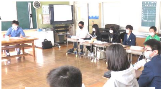
鼓ヶ浦中学校区人権フォーラム2022