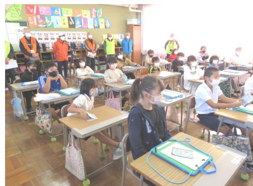
2022/11/25 3年生自然観察 おじさんセミナー 野鳥の会