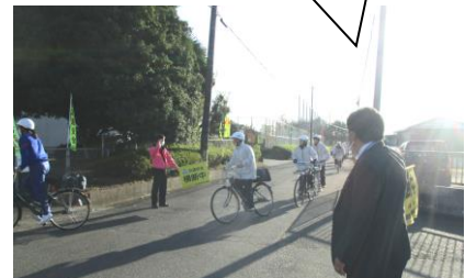
小中交流挨拶運動 中学校正門前

家庭学習強化週間での「学習」と「読書」への意識づけにご協力ありがとうございました！！