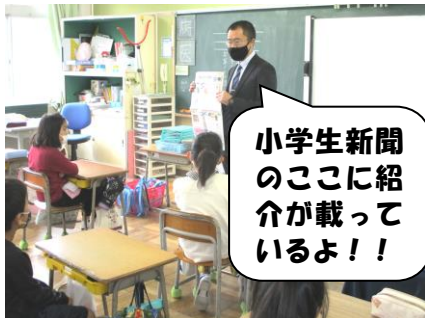
小学生新聞のここに紹介が載っているよ!!

今年度は掲示物を中心に図書ボランティアさんの活動も進めていただいています。階段の踊り場には「子どもの本総選挙」と題して、椿小の子どもたちアンケートの集計による人気作品の紹介もしていただきました。また、学校の昇降口にある小学生新聞の毎週木曜日の記事には、いろいろなお勧めの本を紹介しているコーナーもあります。読書週間には、図書委員主催による「図書祭り」も計画してもらっています。