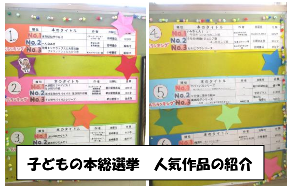
子どもの本総選挙 人気作品の紹介