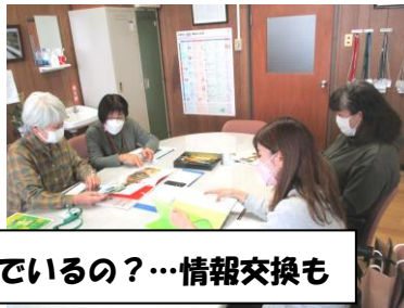
どんな本を選んでいるの?…情報交換も