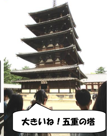
大きいね！五重の塔

(1日目) 法隆寺⇒昼食（古都屋）⇒二月堂・三月堂⇒東大寺⇒二条城⇒清水寺・清水坂…ホテル