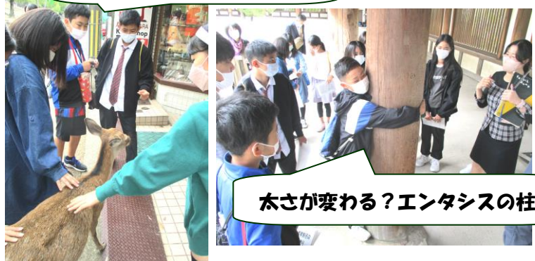
太さが変わる？エンタシスの柱