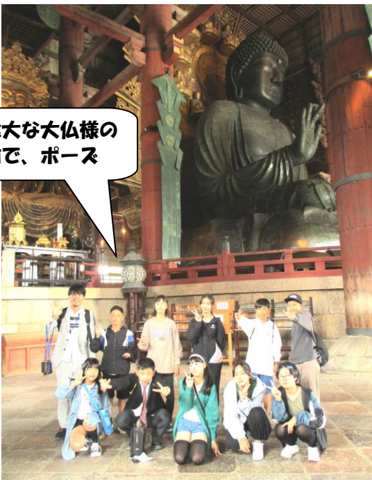
偉大な大仏様の 前で、ポーズ