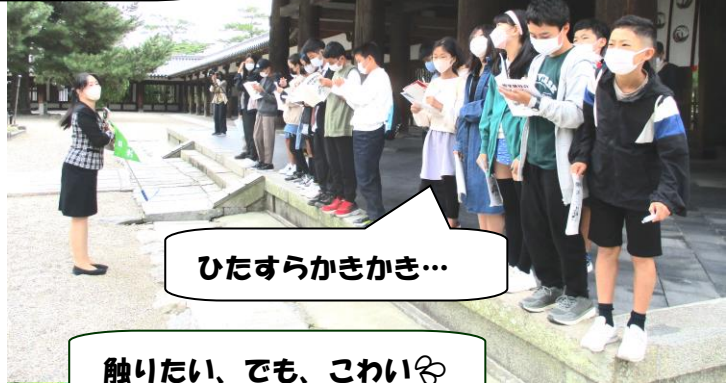
ひたすらかきかき…