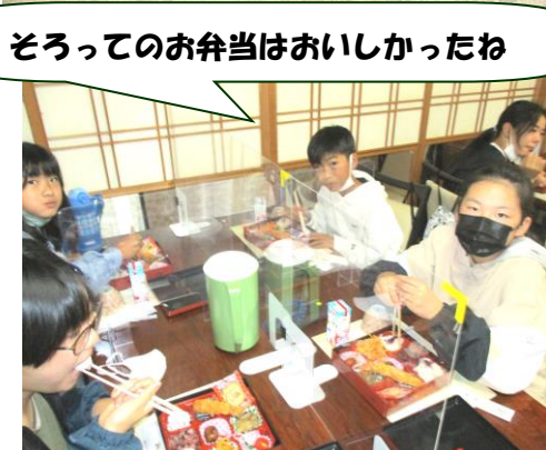
そろってのお弁当はおいしかったね

朝は7時出発。お家の方には温かく送り出していただきありがとうございました。運転手やバスガイドさんは明るく元気で、たくさんのことを教えていただきました。子どもたちはメモを必死にとっていました。社会の歴史の授業で習った歴史的建造物を見つけ、教科書に載っていた写真と実物とを再確認していました。内容は難しくもありましたが、大人になったらきっと懐かしく思い、再来していただけることでしょう。