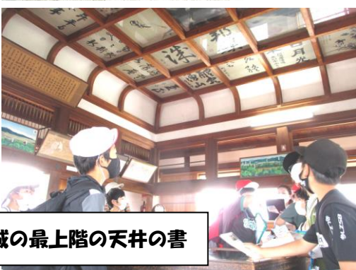
城の最上階の天井の書

城の中を見学しました。子どもたちはそれぞれに気になるところを一生懸命メモしていました。気持ちの良い外でおいしいお弁当を食べた後は、子どもたちが一番楽しみにしていた忍者屋敷の見学です。忍者のからくりや迫力満点の忍者ショーを存分に楽しみました。