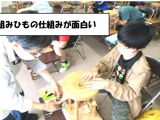
組みひもの仕組みが面白い

まずは 組匠の里 で組みひも体験です。ストラップを作りました。伊賀組みひもは、染め上げた絹糸を束にしたものと金銀糸を組糸に使い、丸台、角台などの伝統的な組台で組上げたものです。独特の風合いがあり、昔から帯締めや羽織の紐に使われていたそうです。じつは、機械製品ならいろいろな紐として身近にあるものです。ひもの仕組みがわかったと同時に、交互に糸を渡すことでだんだん組まれていくひもを不思議そうにみな