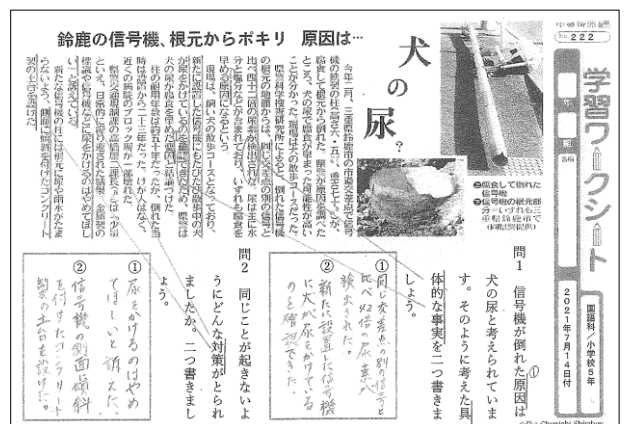
5年生課題ワークシート(新聞記事)例